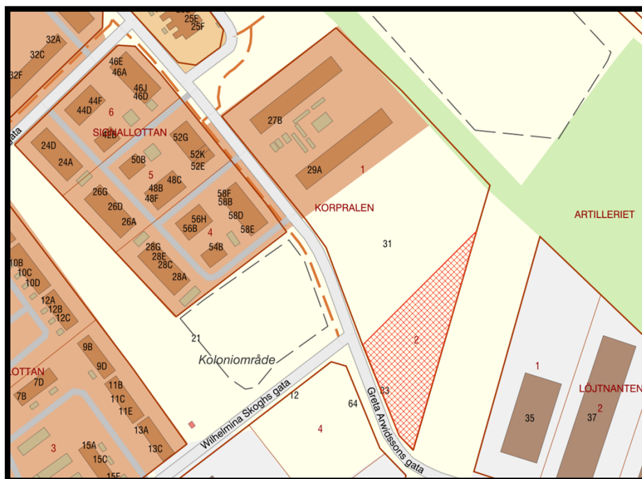
Figur 3 Karta över befintlig parkering, markerad i rött

Teknik- och samhällsbyggnadsförvaltningen har upprättat förslag till ett optionsavtal som innebär att exploatören garanteras en rätt att inom 5 år från det datum detaljplanen vinner laga kraft teckna arrendeavtal för maximalt 36 parkeringsplatser inom Visby Korpralen 2. Arrendet upplåts då med en löptid på 25 år.